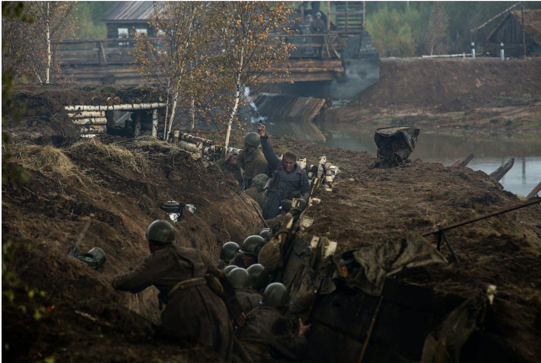
Калужская область «Последний резерв Ставки...»